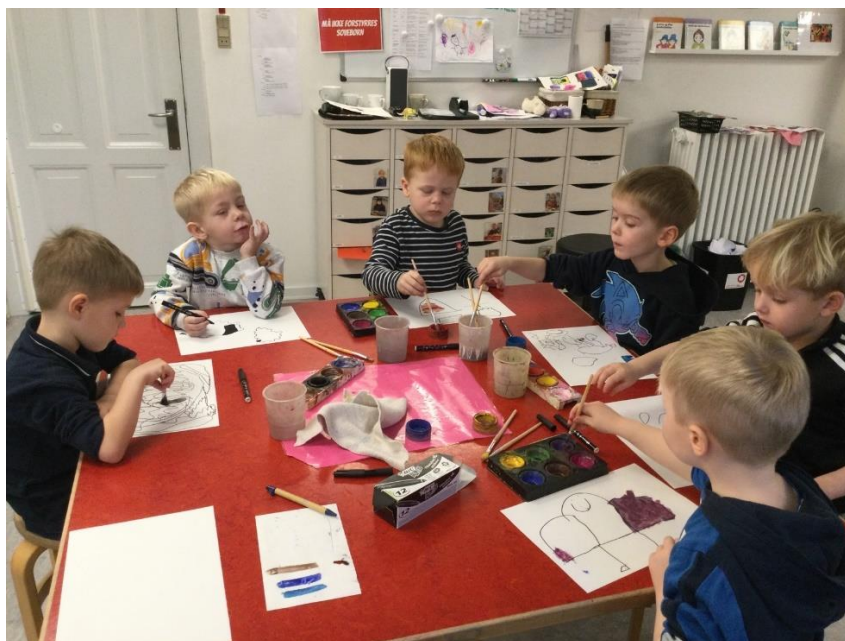
Legegruppe i et læringsmiljø, hvor der er fokus på det kreative

Vi arbejder til stadighed med at kunne tilbyde en høj kvalitet af vores pædagogiske arbejde. Derfor er hver dag struktureret, hvilket betyder at pædagogerne har planlagt fagligt velfunderede aktiviteter for børnene. Aktivitetsplan kan ses på AULA.